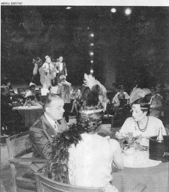
El grup de teatre va representar el musical «Souper Tango»