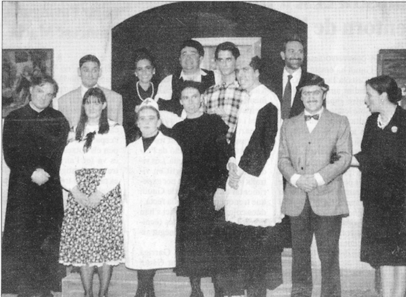
Actors participants en l'obra «La baldirona». Es va representar pel 25è aniversari de l'escola